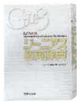
ジーニアス和英辞典 第3版