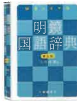
明鏡国語辞典 第三版