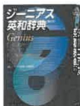
ジーニアス英和辞典 第6版