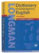
ロングマン 現代英英辞典 6訂版